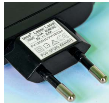
Kontrastreich selbst bei feinsten Beschriftungen