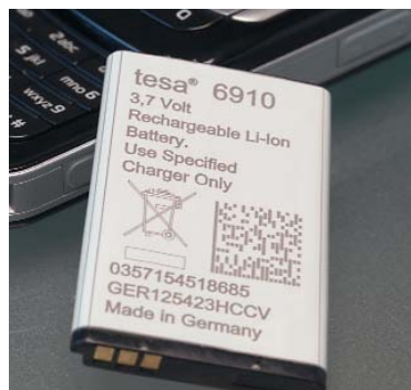
Sehr schnell beschriftbar. Auch direkt in der Fertigungslinie.