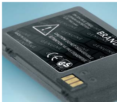
Fälschungsschutz. Variante mit Wasserzeichen