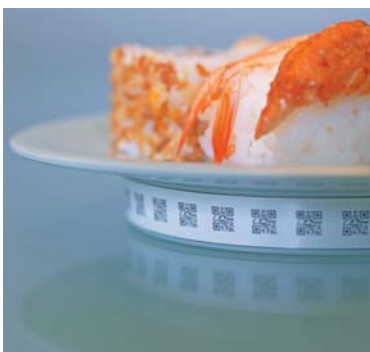
Anwendungsbeispiel aus Japan. Tracking der Frische von Sushitellern