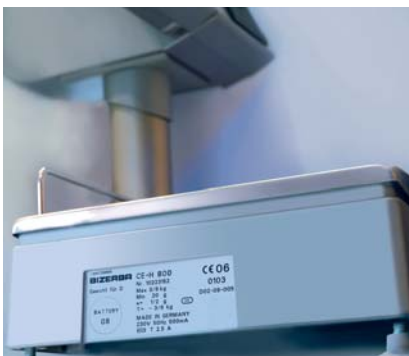
Typenschild. Hält ein Produktleben lang.