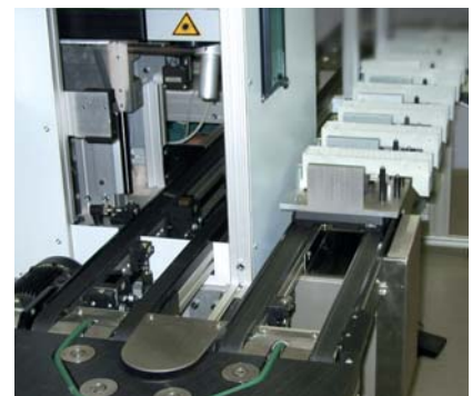
Prozessintegration. Die schnelle Beschriftbarkeit ermöglicht die Integration in eine automatisierte In-Line Fertigung.